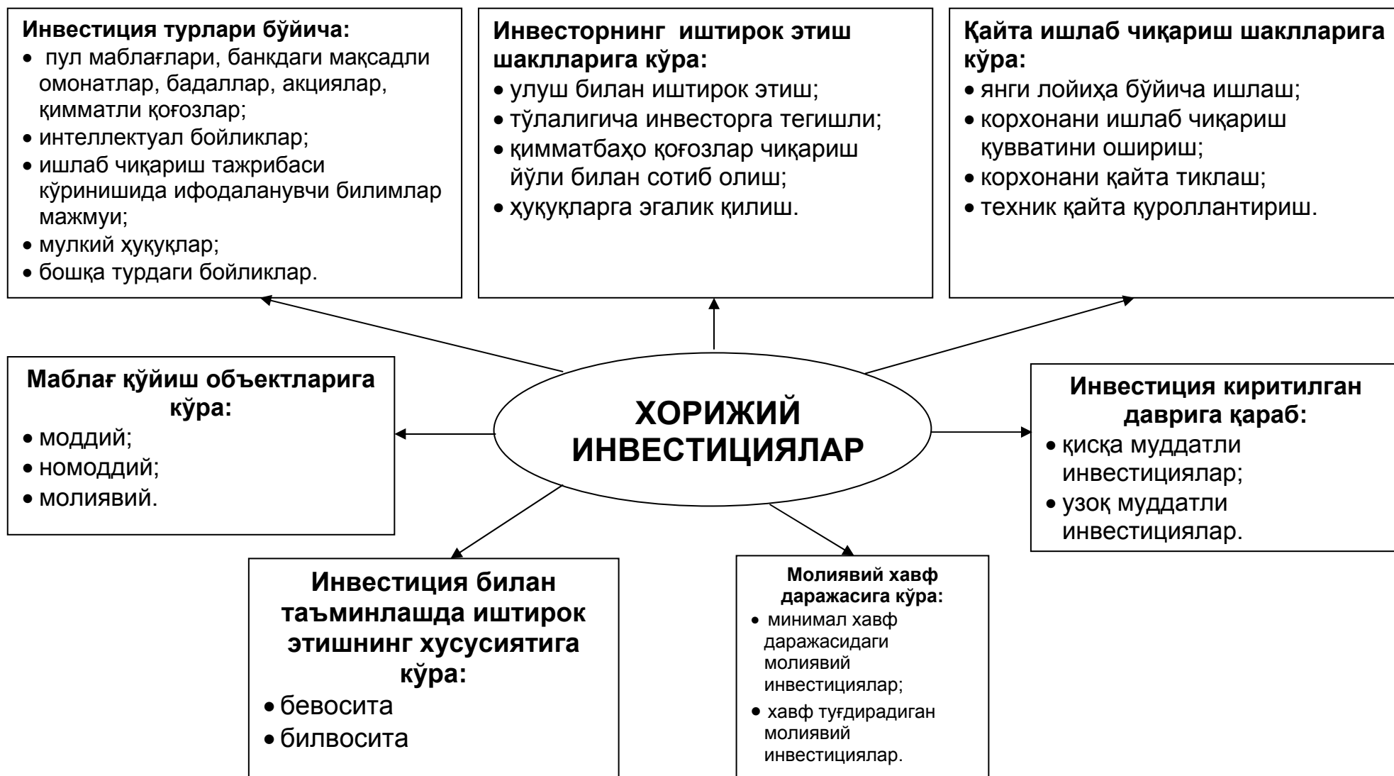
1-расм. Хорижий инвестицияларнинг таснифланиш белгилари 7