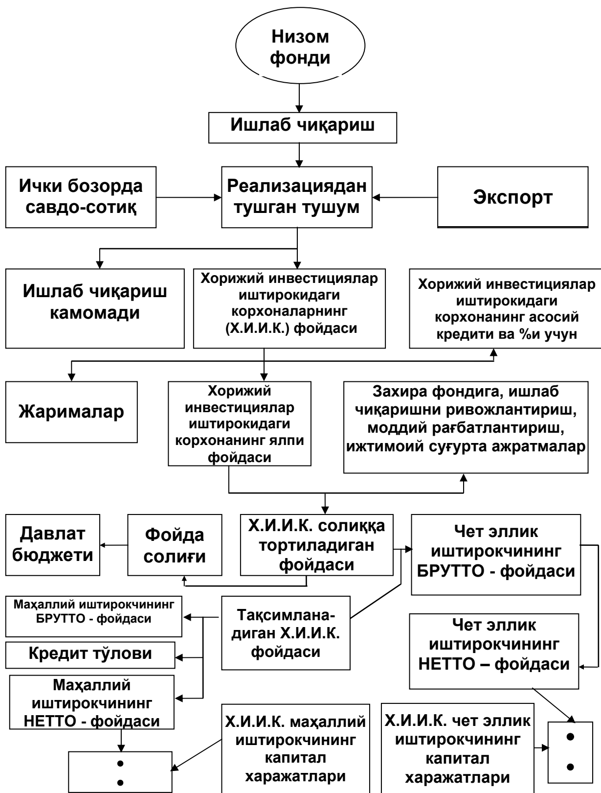
2-расм. Хорижий инвестициялар иштирокидаги корхоналар иқтисодий фаолиятининг умумий тамойиллари 8 .