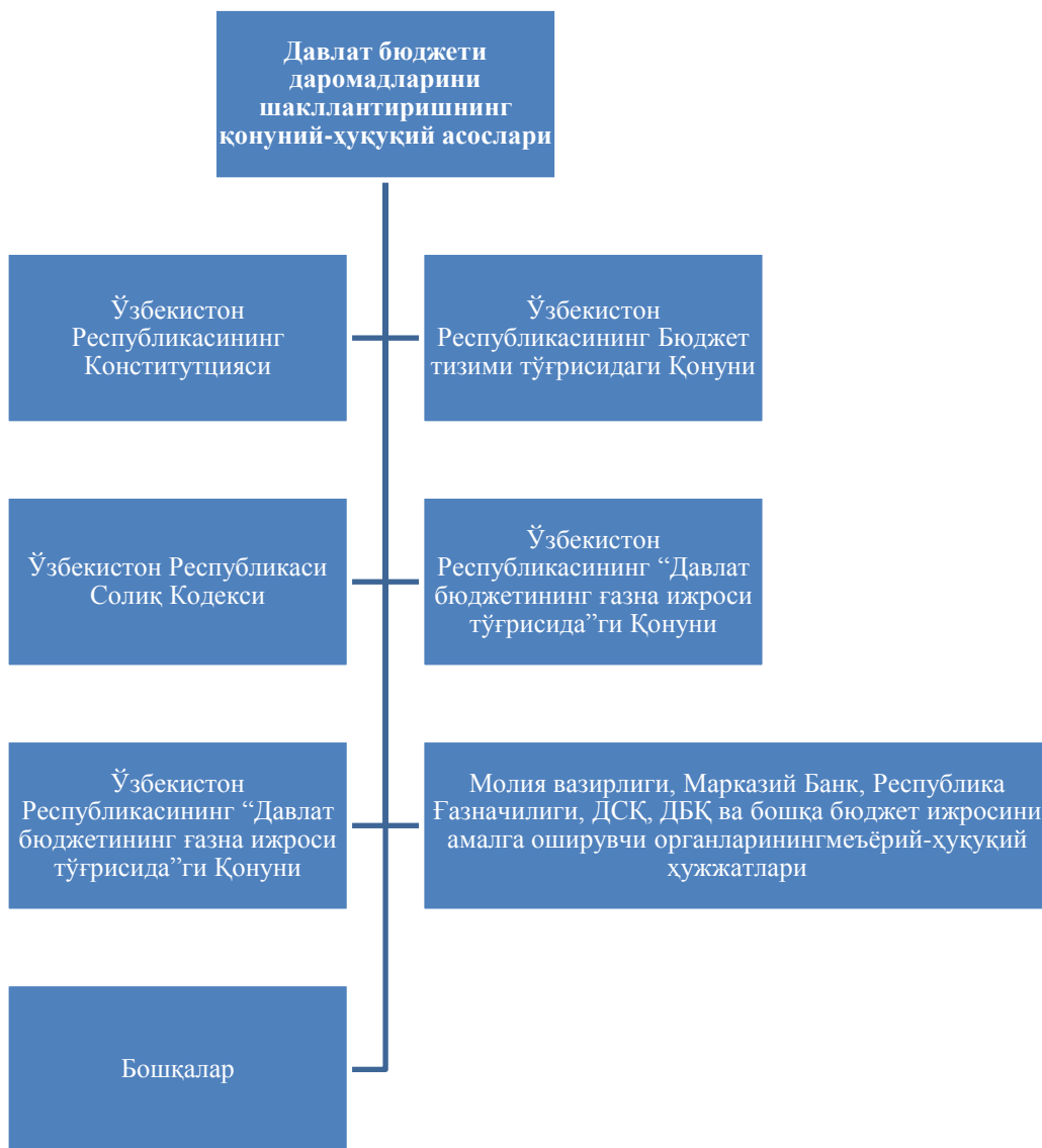
2-расм. Давлат бюджети даромадларини шакллантиришнинг ҳуқуқий асослари 4

келтирилган 2-расмда давлат бюджети даромадларини шакллантириш ва уларни бошқаришнинг ташкилий-ҳуқуқий асослари келтирилган.