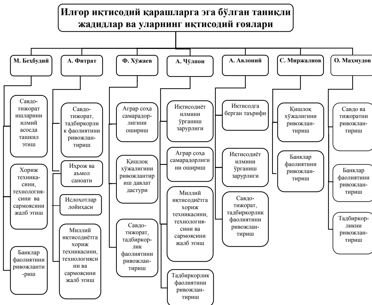
1-расм. Жадиждлар ва уларнинг иқтисодий ғоялари 6

Туркистонда XIX аср охири ва XX аср бошидаги ижтимоий-иқтисодий жараёнлар ва муносабатлар жадиждларнинг иқтисодий ғояларида биринчи марта таҳлил қилинган. Жадиждлар иқтисодий ғояларида иқтисодий илмни ўрганиш зарурлиги, ихрож ва аъмол саноати, ижтимоий-иқтисодий ислохотлар масаласи, иқтисодиётга хорижий сармояларни, илғор техника-технологияларни жалб этиш, Туркистонда банклар фаолиятининг ўрни ва аҳамияти, савдо-тижорат ишларини илмий асосга қуриш, тадбиркорлик, аграр иқтисодиёт самарадорлигини ошириш масалалари катта ўрин тутди. Булар М.Бехбудий, А.Фитрат, Ф.Хўжаев, А.Чўлпон, А.Авлоний, С.Миржалилов, О.Маҳмудов сингари жадиждчилардир. Уларнинг Чоризм зулми остидаги Туркистоннинг ижтимоий- иқтисодий ҳолатлари хусусидаги қарашлари чуқур тадқиқ этилди ва туркумланди (1-расм).