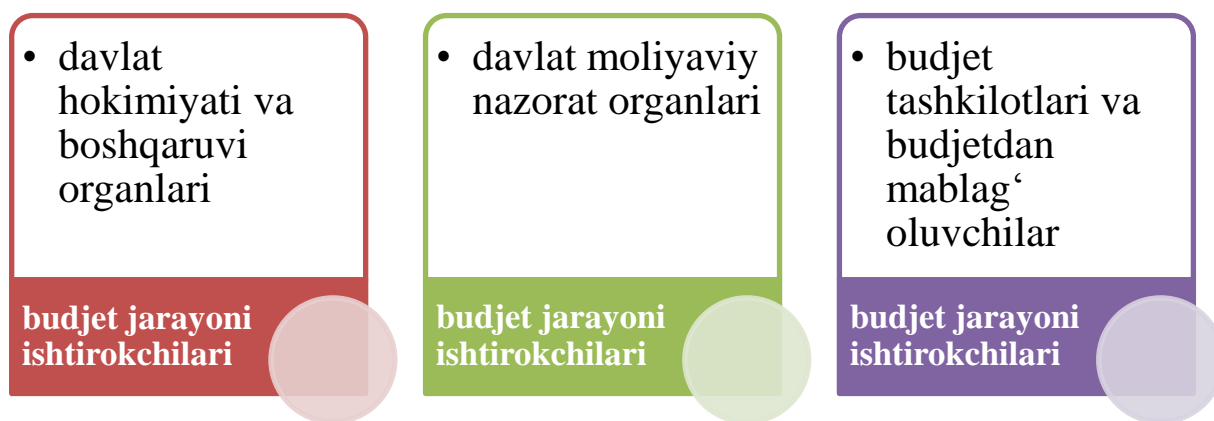
1-rasm. Budjet jarayoni ishtirokchilari 1

budjetining g‘azna ijrosi to‘g‘risida”gi 664-II sonli Qonuni qabul qilingan edi. Ushbu Qonun O‘zbekiston Respublikasi davlat budjetining (shu jumladan davlat maqsadli jamg‘armalarining) va budjet tashkilotlari budjetdan tashqari mablag‘larining g‘azna ijrosi sohasidagi munosabatlarini tartibga solishga xizmat qildi. Mazkur qonunda davlat budjeti g‘azna ijrosini tashkil etish va g‘aznachilik faoliyati bilan bog‘liq holatlar o‘zining huquqiy asosiga ega bo‘ldi. Ushbu qonunda G‘aznachilikning maxsus hisobraqamlari va ularning amal qilish tartiblari belgilangan edi. Lekin 2014 yilda qabul qilingan Budjet Kodeksida amaldagi “Budjet tizimi to‘g‘risida”gi hamda “Davlat budjetining g‘azna ijrosi to‘g‘risida”gi O‘zbekiston Respublikasi Qonunlarida belgilangan normalar mukammal tarzda qayta ishlangan holda o‘z aksini topdi. Xususan, yagona g‘azna hisobvarag‘i O‘zbekiston Respublikasi Moliya vazirligi tomonidan boshqariladigan maxsus bank hisobvarag‘i ekanligi hamda O‘zbekiston Respublikasi Moliya vazirligining bank hisobvaraqlariga xizmat ko‘rsatilganligi uchun haq olinmasligi Budjet Kodeksida belgilab qo‘yildi.