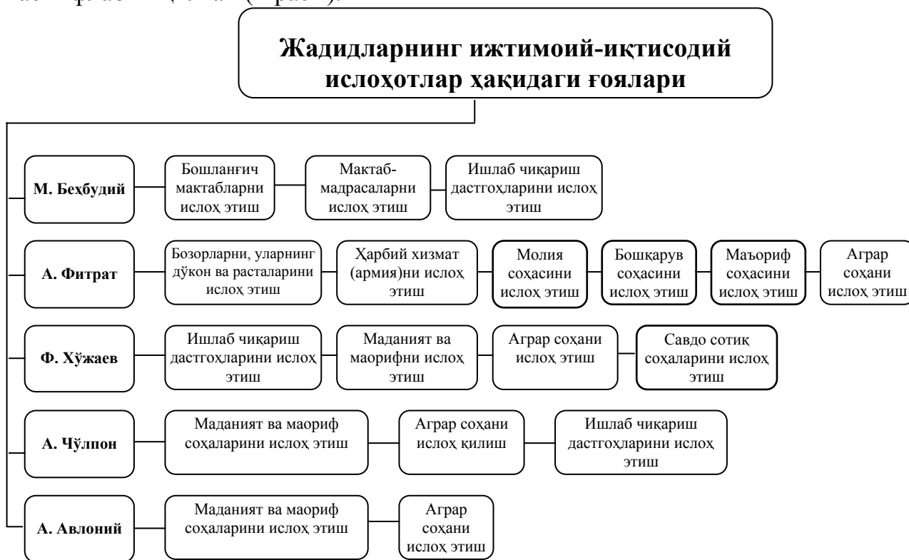
2-расм. Жадидларнинг ижтимоий-иқтисодий ислоҳотлар ҳақидаги ғоялари 17

Тадқиқотда жадидчилик вакилларининг ижтимоий-иқтисодий ислоҳотлар ҳақидаги ғоялари, мамлакат иқтисодий тараққиётига қўшган ҳиссаси чуқур таҳлил этилади. Улар мамлакатда иқтисодий маконни ташкил қилиш, мулкдорларга ҳуқуқий кафолатлар бериш, мактаб-маориф тизимини янгилаш, халққа маъқул диний сиёсат олиб бориш, фан, бошқарув, ишлаб чиқариш, иқтисодиётнинг муҳим бўғини бўлган қишлоқ хўжалиги, пахтачиликнинг агротехникасини такомиллаштиришга доир қарашлари билан ислоҳотчилик ғояларини илгари сурганликлари диссертацияда батафсил таҳлил этилган ва таснифлаб чиқилган (2-расм).