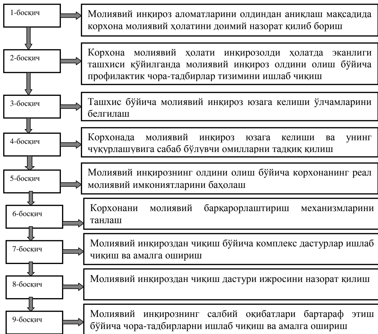
3.2-расм. Инқирозга қарши молиявий бошқарув жараёнининг асосий босқичлари 15

Инқирозга қарши молиявий бошқарув жараёнининг асосий босқичлари қуйидаги расмда акс эттирилган (3.2-расм).