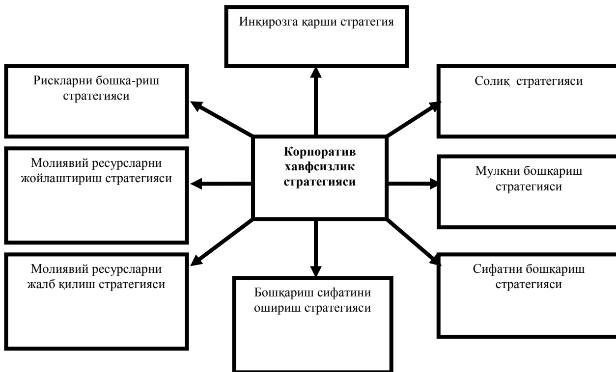
3.1-расм. Корпоратив хавфсизлик стратегиясининг молиявий стратегия асосий йўналишлари билан боғлиқлиги 14

Корпоратив молиявий хавфсизлик стратегияси одатда корхоналарнинг инқирозга учрашининг олдини олишга қаратилади. Бу борада корхоналарда молиявий хавфсизликни таъминлаш стратегияси доирасида инқирозга қарши молиявий бошқарувни самарали ташкил этиш мақсадга мувофиқ.