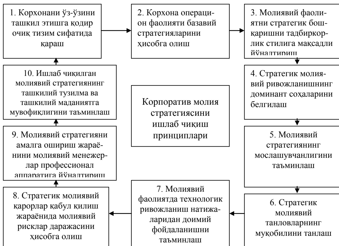
1.1-расм. Корхона молиявий стратегиясини ишлаб чиқиш принциплари

Корхонанинг молиявий стратегиясини ишлаб чиқиш замирида бошқарувнинг янги принциплари яхлитлиги асосида шакллантириладиган стратегик бошқарув тизими ётади. Корхона молиявий стратегиясини ишлаб чиқиш жараёнида стратегик молиявий қарорлар тайёрлаш ва қабул қилишни таъминловчи асосий принциплар қаторига қуйидаги расмда келтирилган (1-расм).