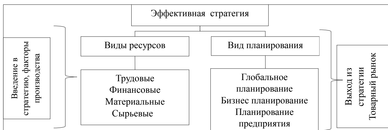
Рис. 3. Модель эффективной стратегии 15

во-вторых, сложно определить уровень полезности того или иного ресурса в денежном выражении. Следовательно, при разработке эффективной ресурсной стратегии на местных предприятиях следует использовать два важных методологических подхода, то есть обобщенные методы стратегического планирования при определении потребности в экономических ресурсах, и целесообразно использовать как можно больше натуральных показателей (измерителей) в расходовании производственных ресурсов. Ресурсное планирование, внедренное на многих предприятиях, является одним из обоснованных этапов в производственной деятельности. Этот этап повышает эффективность эффективной стратегии распределения и потребления материальных ресурсов, которые, в свою очередь, влияют друг на друга, так как они влияют на остальной производственный процесс. При этом следует отметить, что не только отечественные строительные компании, но и зарубежные компании имеют практику удовлетворения потребностей в ресурсах, в основном, за счет финансового планирования. По мнению некоторых экономистов, основным критерием при разработке эффективной стратегии считаются деньги, а для других - покупка ресурсов. Однако, исходя из опыта зарубежных предприятий, исходя из периода ресурсного резерва, они не могут покупать лишние ресурсы. Потому что это явление, связанное с производством предприятия или изменением конъюнктуры рынка. Но на предприятиях так бывает не всегда. При этом технологии, навыки персонала не могут быть куплены заранее.