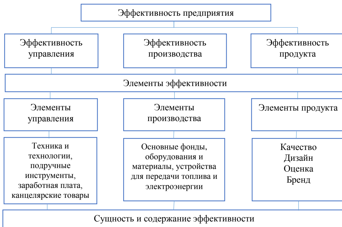
Рис. 2. Модель эффективности управления предприятием 11

Во второй главе диссертации «Анализ механизмов управления экономической эффективностью предприятий по производству строительных материалов», проанализированы организационные механизмы управления экономической эффективностью промышленных предприятий по производству строительных материалов, экономического развития промышленных предприятий по производству строительных материалов, анализ повышения экономической эффективности промышленных предприятий по производству строительных материалов, элементы механизма эффективности, в этом направлении разработаны конкретные меры, реализован комплексный подход к экономическому развитию предприятий.