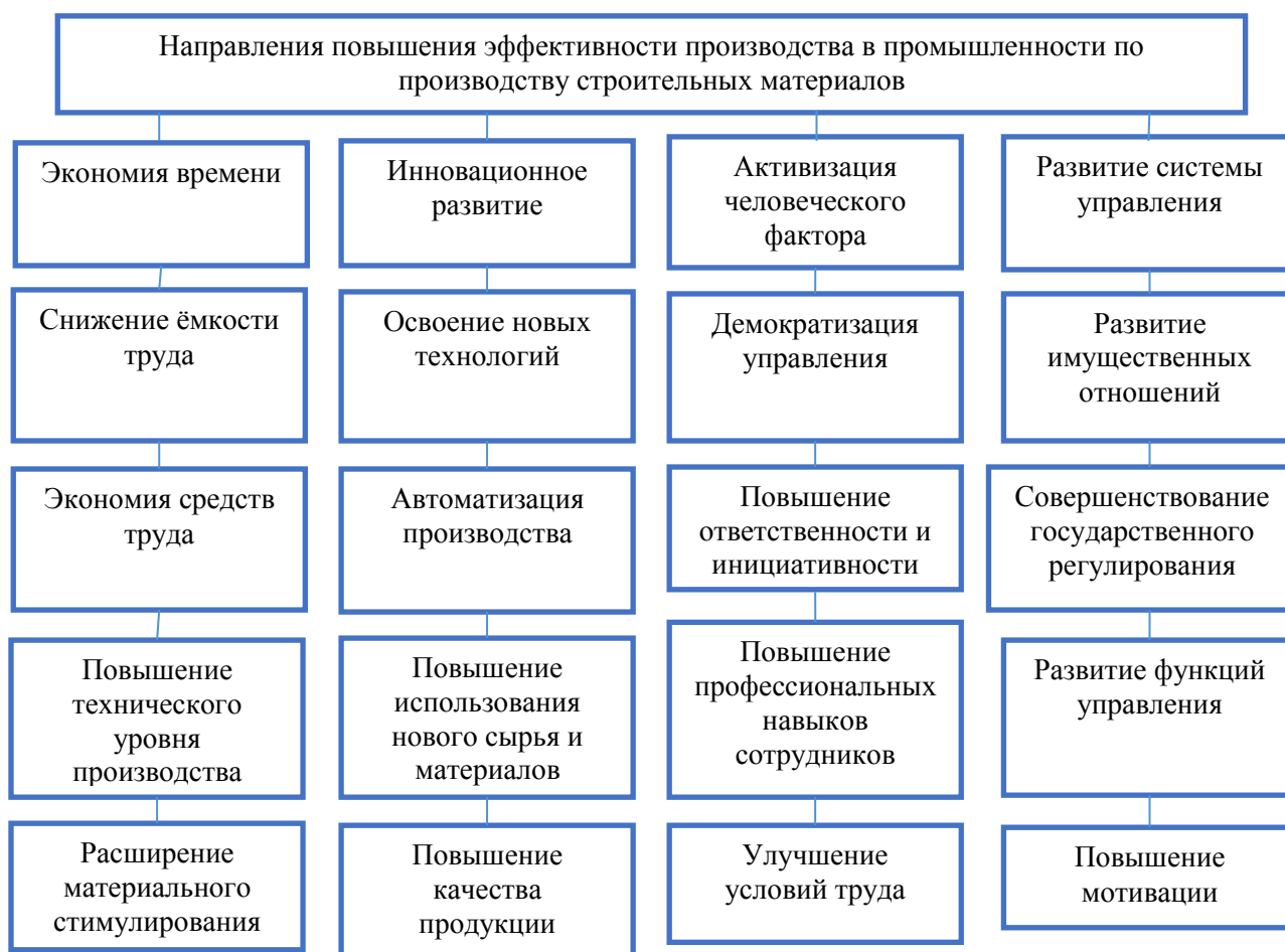
Рис. 5. Направления повышения эффективности промышленности по производству строительных материалов 17

Повышение экономии ресурсов при использовании ресурсов является одним из важных направлений повышения эффективности и интенсификации производства. Экономия ресурсов играет ключевую роль в удовлетворении спроса на топливо, энергетическое сырье и материалы, особенно в промышленном производстве. При использовании любого ресурса важно помнить, что он ограничен. Потому что любой ресурс, особенно ресурсы добычи, приходит в упадок. На сегодняшний, в условиях формирования экономики нашей республики, необходимо увеличивать использование альтернативных видов ресурсов. Необходимо ввести систему более широкого использования в производстве недорогих и экономичных технологий. Кроме этого, необходимо побольше использовать вторичные ресурсы.