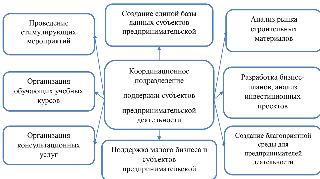
Рис. 4. Основные направления деятельности подразделения, координирующего поддержку субъектов предпринимательской деятельности 16

Целесообразно создание единой базы данных субъектов предпринимательской деятельности отрасли, анализ рынка строительных материалов, создание благоприятного инвестиционного климата для предпринимательства, организация обучающих курсов, консультационных услуг (рисунок 4).