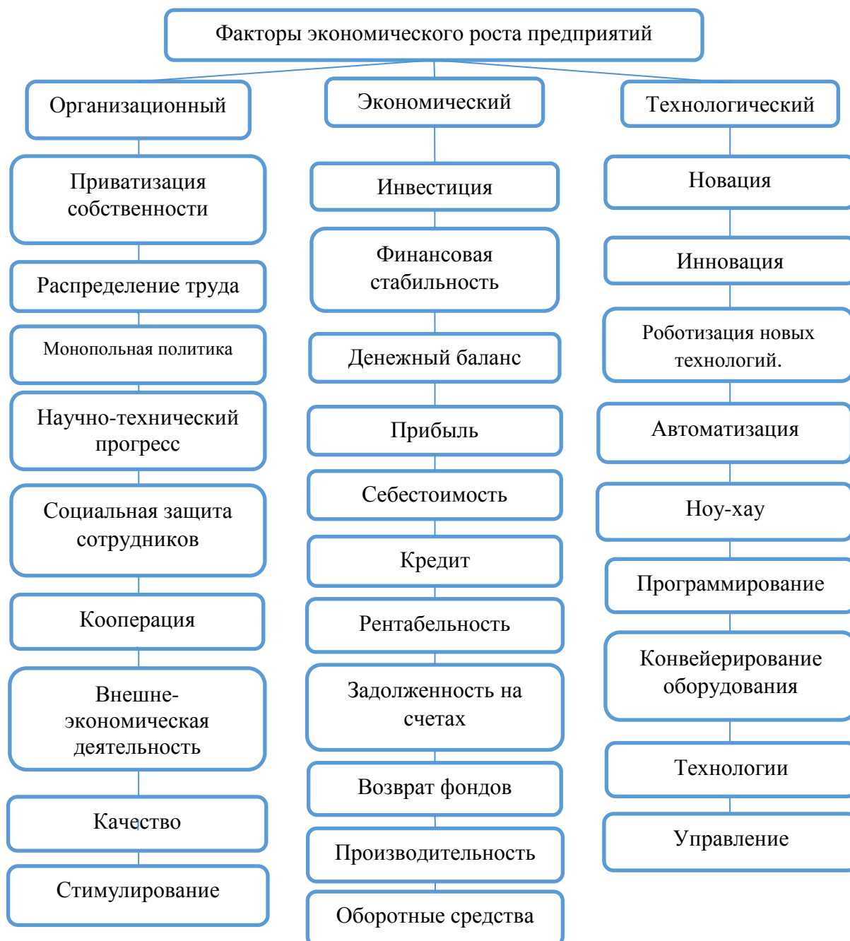
Рис. 1. Факторы экономического роста промышленных предприятий 10

В научной работе предлагается концептуальная модель для углубления содержания взаимозависимости и взаимозависимости видов эффективности (рисунок 2).