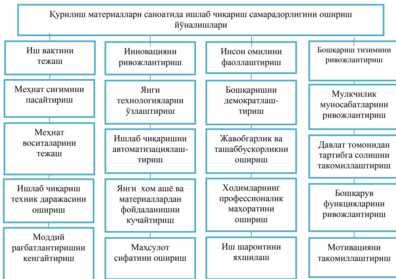
5-расм.Қурилиш материаллари саноати корхоналарида самарадорликни ошириш йўналишлари 17

Шундай қилиб, юқоридагилардан келиб чиқиб, ишлаб чиқариш самарадорлигини оширишнинг асосий йўналишларини қуйидаги 5-расмда ифодалаш мумкин: