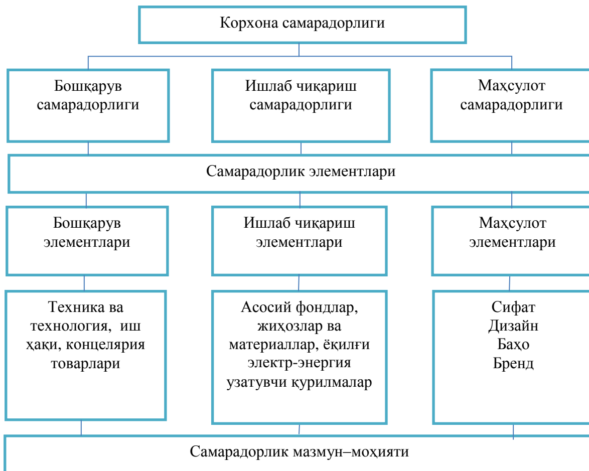
2-расм. Қурилиш материаллари саноати корхоналарининг иқтисодий самарадорлигини ошириш модели 11

Илмий ишда самарадорлик турларининг ўзаро алоқадорлиги ва бир-бирига боғлиқлиги мазмун-моҳиятини чуқурроқ асослаш учун концепция модели таклиф этилган (2-расм).