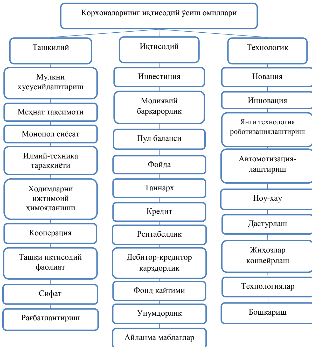
1-расм. Қурилиш материаллари саноати корхоналарида иқтисодий самарадорликни оширишга таъсир этувчи омиллар 10

Авваламбор, ушбу омилларнинг уч гуруҳдан иборат эканлигини таъкидлаб ўтган холда уларни ташкилий, иқтисодий ва технологик омилларга бўлдик. Саноат корхоналарининг иқтисодий ўсишга таъсир этадиган омиллар қуйидаги 1-расмда кўрсатилган.